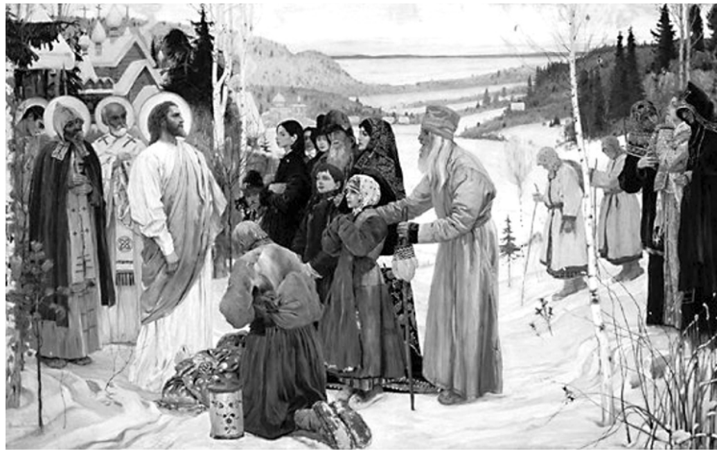
М.В. Нестеров. Святая Русь.

заповедь. И как нельзя лучше мы исполним ее, если будем молиться ежедневно (после епитимий) Помянник (большой, стр. 72). В нем заключается молитва и о благостоянии Церкви, через которую мы имеем возможность и надежду вечного спасения; и о мирном течении жизни Отечества, необходимом для благополучного жительства в правоверии и "всяком благочестии"; и о предрержавших властях, духовных и гражданских; и об единоверной братии нашей, ближних и дальних, всякого рода и сословия; и об "отступивших от православия веры и погибельными ересью ослепленных", находящихся вне Церкви Христовой, этого единственно спасительного Корабля, и шествующих к вечной смерти, о которых мы также должны вздыхать пред общим нашим Творцом и Спасителем; и об усопших "иже от века" правоверных христианах...Молясь за всех "со всяким умилением и усердием", великую пользу верующий человек приобретает себе и в сей жизни, и в будущей.