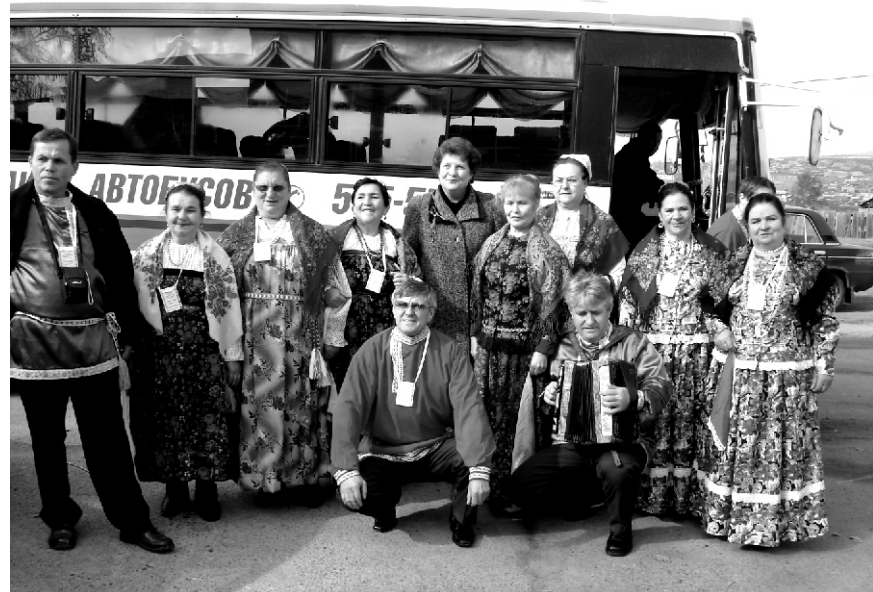
Хор староверов-липован "Ландыш" перед выездом в с. Тарбагатай.