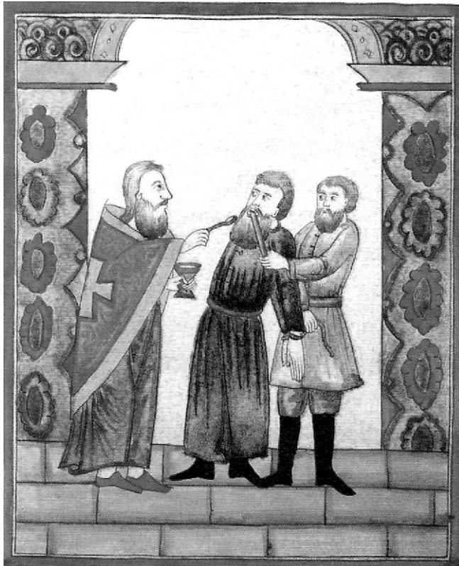
Никоново причастие. Иллюстрация из книги "Сказание о житии Патриарха Никона" XVIII в.

признавать его как главу, и ничего превышающего их власть не творить без его рассуждения: творить же каждому только то, что касается до его епархии, и до мест к ней принадлежащих. Но и первый ничего да не творит без рассуждения всех. Ибо так будет единомыслие, и прославится Бог о Господе во Святом Духе, Отец, Сын и Святой Дух» (34 пр. св. Апостол). А коль скоро печатные богослужебные и вероучительные книги, как уже было сказано, распространялись по всей Церкви, и следовательно касались всех, то и смысловые изменения в них, прибавления или убавления, всенепременно должны были обсуждаться соборно, а тем более, если изменения эти касались не только самих богослужебных текстов, но и содержащихся в книгах поучений о предметах веры, церковных уставах и преданиях. Тем не менее, патриарх Никон сразу же по занятии им патриаршей кафедры показал себя противником всякого духовного совета и соборного рассуждения, начав по собственному произволу вносить в церковные книги изменения, касающиеся не только орфографии, но и древнейших церковных преданий и уставов: «Самое печатание книг производится в это время в духе новых воззрений.