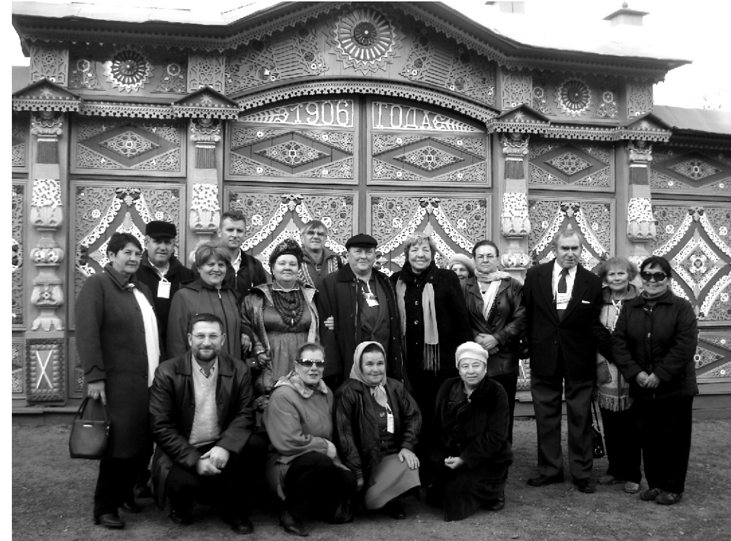
Липоване и семейские в Этнографическом музее народов Забайкалья. 12 октября 2009 г.

яркие и расписные, а традиционная липованская кухонная утварь давно заменена современной техникой, то в некоторых семейских селах Бурятии эта самобытность сохраняется. Все же для сохранения русского языка в Румынии проводятся разнообразные мероприятия: печатаются старообрядческие газеты и журналы на русском языке, проводятся соревнования, олимпиады. В 2003 году мэр Москвы Юрий Лужков подарил румынам русского происхождения 10 тыс. томов учебников и хрестоматий для учеников, изучающих родной русский язык.