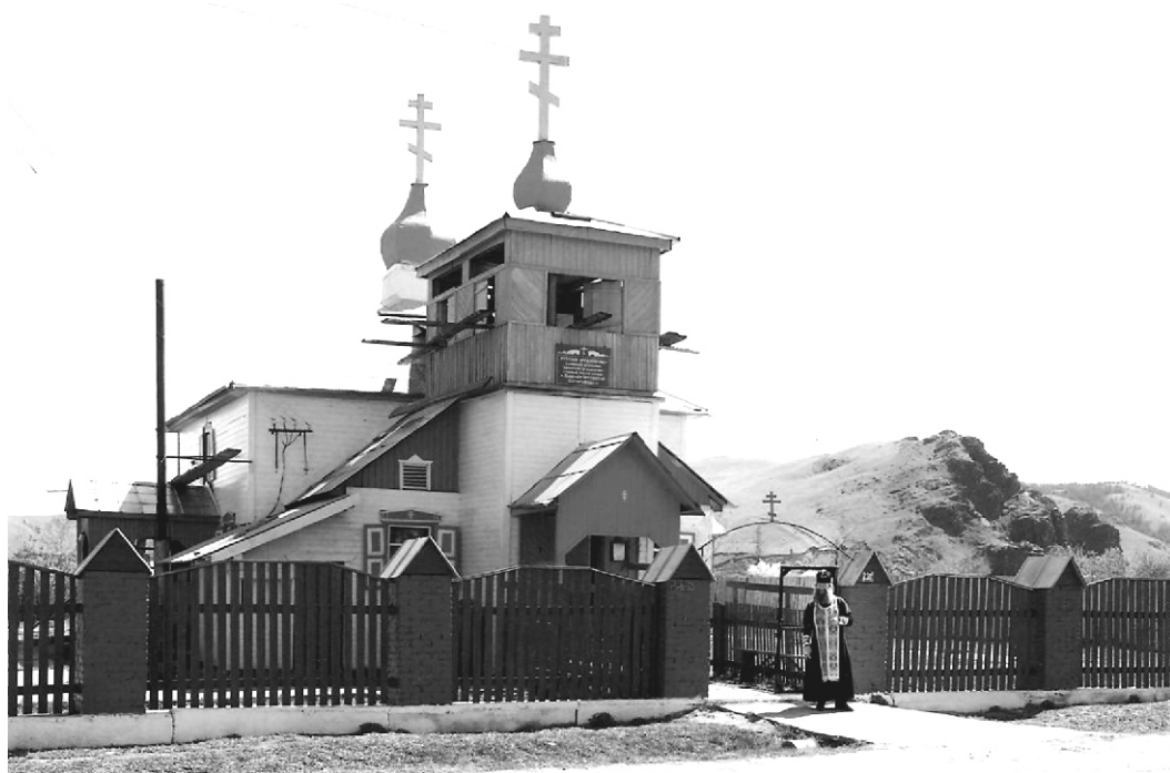
Древлеправославный храм Покрова Пресвятой Богородицы. Село Бичура.