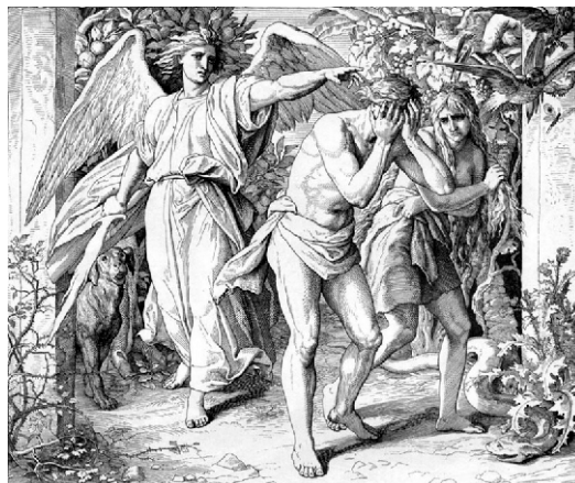
Грехопадение. Изгнание из Рая.

самом чреве китовом, призвав Бога, устранили все угрожающие бедствия и привлекали к себе высшее благоволение. Что же ты должен говорить, когда молишься? То же, что и хананеянка. Как она говорила: "помилуй меня... дочь моя жестоко беснуется" (Мф. 15:22), так и ты говори: помилуй меня, душа моя жестоко беснуется. Грех есть великий бес. Бесноватый возбуждает сострадание, а грешник - ненависть. "Помилуй меня": краткое слово, (но оно нашло) море