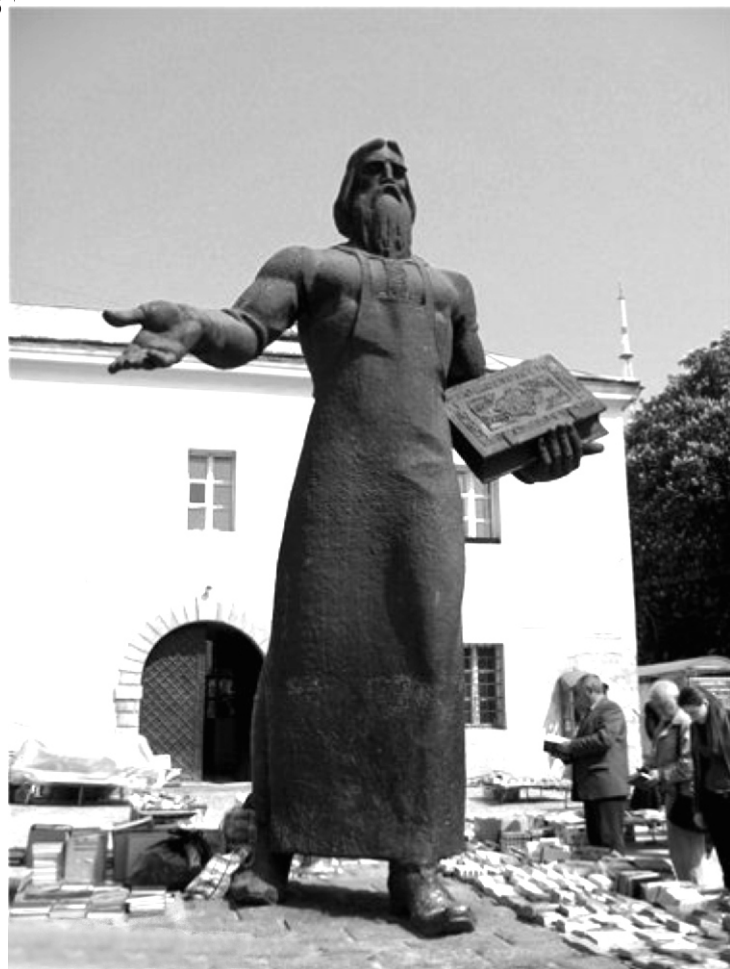
Памятник Иоанну Федорову в г. Львов.