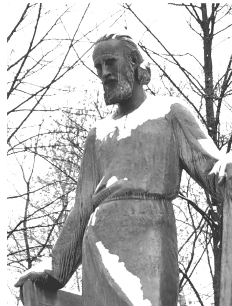
Андрей Рублев. Памятник в г. Москва.

Важное свидетельство о почитании иконописца оставил преподобный Иосиф Волоцкий (+1515; память 15/28 сентября). В «Отвещании любозаборным и кратком сказании о святых отцах, бывших в монастырях, которые в Русской земле» он писал со слов старца Спиридона, что преподобные Даниил и Андрей были настолько добродетельны и ревностны в иноческой жизни, что сподобились божественной благодати. Они были так исполнены божественной любви, что никогда не упражнялись в земном, но всегда ум возносили к невещному и божественному свету, чувственное же око всегда возводили к написанному вестественным красками образом Христа и Пречистой Его Матери и всех святых. В самый праздник Светлого Христова Воскресения они, сидя на седалищах и имея пред собою всечестные и божественные иконы, взирали на них неуклонно, исполняясь божественной радости и светлости. И не только в этот день так творили, но в прочие дни, когда не занимались иконописанием. Ради этого Владыка Христос прославил их и в конечный час смертный. Прежде преставился преподобный Андрей, а потом