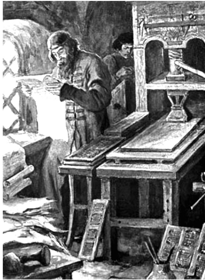
Русский первопечатник Иоанн Федоров.

Основой для создания первой православной печатной Библии стала рукописная Библия новгородского архиепископа Геннадия, жившего в XV веке. Эту Библию по просьбе князя Константина Острожского прислал сам русский царь. Кроме Библии архиепископа Геннадия были использованы библейские тексты, привезенные из Италии, библиотек острова Крит, сербских и