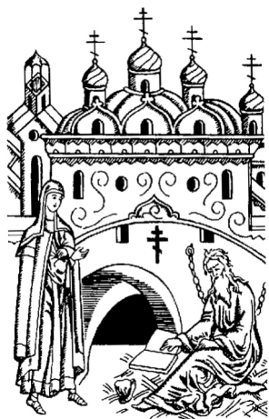
Издание Сибирской Епархии Русской Древлеправославной Церкви