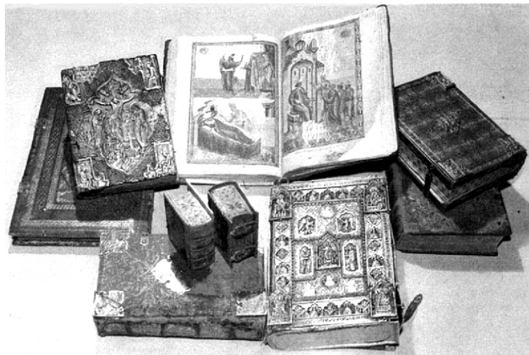
Русские старопечатные книги.

«Острожская Библия» стала ценнейшим даром для всего христианского мира и первой печатной Библией во всем православном мире. При этом необходимо отметить, что даже первая печатная [Продолжение на С.4]