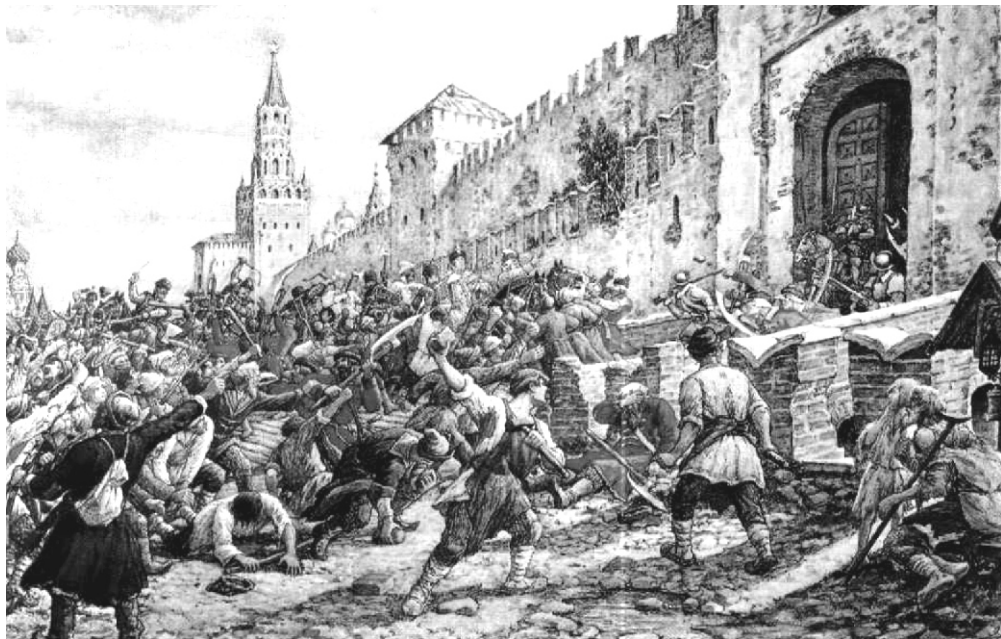
"Бунташный век". Церковная реформа Никона.

«Тяжелое наследство оставил Никон своему бывшему «собинному» другу — царю Алексею Михайловичу. Все в тогдашней нашей церковной жизни сверху донизу находилось в полном смятении и как бы в разложении, ни в чем не было устойчивости, определенного порядка и прочности, все как бы шаталось, всюду видны были только рознь, раздоры, взаимная ненависть и борьба. Общая нелюбовь лично к Никону перешла и на его реформу: большинство, как мы показали, относилось к ней отрицательно, сами архиереи сначала видели в ней только личное дело одного Никона, только проявление его патриаршего самовластия и самочиния. Даже ученые греки смотрели на Никона за его церковно-реформаторскую деятельность как на опасного новатора, как на разорителя вековых