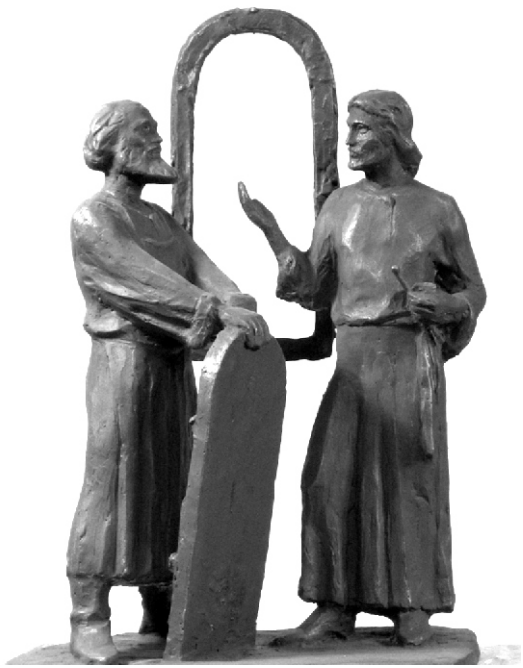
Феофан Грек и Андрей Рублев. Скульптура.

московские митрополиты. Вместе с Симеоном Чёрным расписал церковь Рождества Богородицы (1395) и Архангельский собор (1395); вместе с Андреем Рублёвым и Прохором с Городца расписал старый Благовещенский собор Московского Кремля (1405), где Феофану Греку принадлежит большинство икон: «Спас», «Богоматерь», «Иоанн Предтеча», «Архангел Гавриил», «Апостол Павел», «Иоанн Златоуст», «Василий Великий». Работы Феофана Грека отличаются монументальностью, внутренней силой и драматической выразительностью образов. Труды Феофана высоко ценили на Руси, называя иконописца философом. Созданная им в Москве мастерская стала школой для многих иконописцев того периода. «Преславный мудрец, философ зело хитрый... книги иконограф нарочитый и среди иконописцев отменный живописец», — так характеризует Феофана Грека известный церковный писатель, его современник монах Елифаный Премудрый.