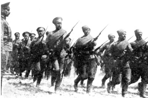
Русские солдаты Первой мировой войны.