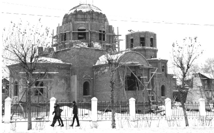
Строящийся храм во имя Рождества Христова, г. Улан-Удэ, декабрь 2010 г.

Сейчас строится лестница в колокольню, идёт подготовка к кровельным работам.