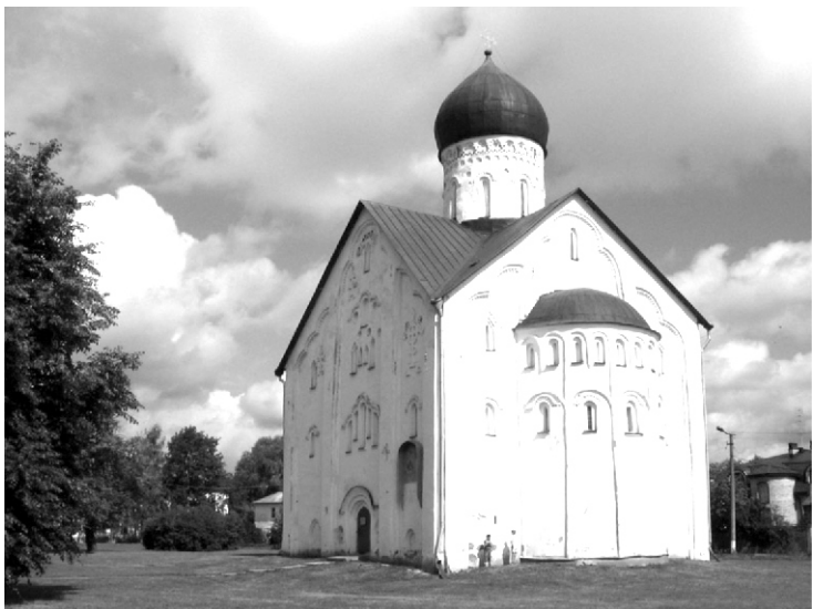
г. Новгород Великий. Церковь Спаса Преображения на Ильине, расписанная в 1378 г., где сохранились фрески Феофана Грека в первозданном виде.

В 2010 году исполнилось 600 лет со дня преставления известного древнерусского иконописца Феофана Грека.