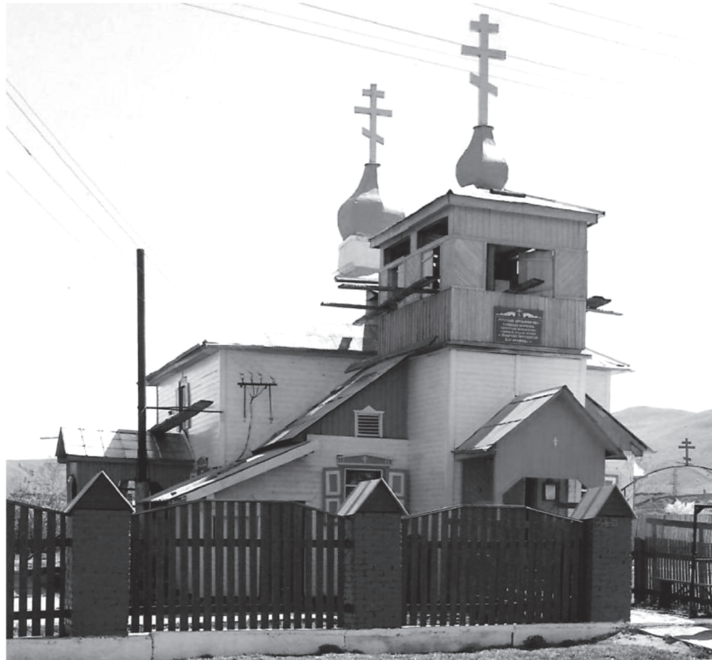
Древлеправославная церковь во имя Покрова Пресвятой Богородицы с. Бичура

С 1795 по 1808 гг., т. е. за 13 лет, население Бичуры выросло на 239 человек, и в Бичуре проживало уже 610 человек. Известно, что в XIX веке происходило доселение в Бичуру