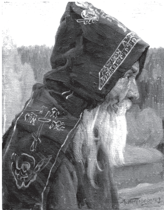
Монах. Художник М.В. Нестеров. 1913 г.

По указанию Никона святитель Павел вместе с несколькими иноками-прислужниками был послан на Онежское озеро, в далекий Палеостровский Рождественский монастырь. Условия заточения в сем монастыре были весьма жестокими, недаром Павел Алеппский с содроганием писал о судьбе сосланного святителя: «Умереть лучше было бы для него, чем жить там, по причине великого стеснения и жалкой жизни, постоянного мрака, голода и совершенного отсутствия хлеба; оттуда ему невозможно