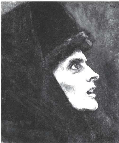
Боярыня Морозова. Фрагмент картины. Художник В.И. Суриков.

Боярыня Феодосия родилась в Москве 21 мая 1632 г. в семье окольного Прокопия Федоровича Соковнина, родственника Марии Ильиничны Милославской, первой жены царя Алексея Михайловича. Семнадцати лет была выдана замуж за боярина Глеба Ивановича Морозова, младшего брата царского дядьки и свояка, стольника Бориса