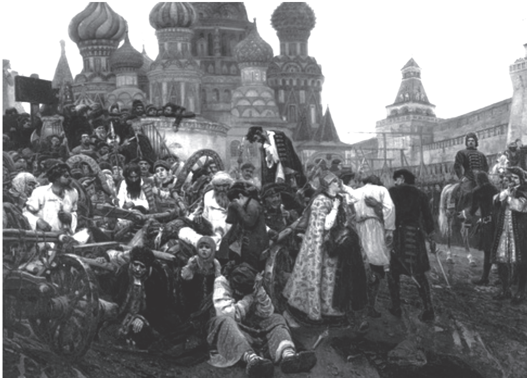
Утро стрелецкой казни. Художник В.И. Суриков. 1881 г.

Менялись цари, менялись власти, режимы, а репрессии против ревнителей древлеправославной веры и древнего благочестия не прекращались. Они или ужесточались, что происходило в царствование Софьи, Петра I, Анны Иоанновны (бироновщина), Павла I, Николая I, в безбожное советское время; или несколько затухали, ослабевали при Екатерине II, Александре I, Александре III, Николае II, но никогда не прекращались. Поэтому старообрядцы бежали, кто куда мог, уходили за пределы России. Это была первая волна