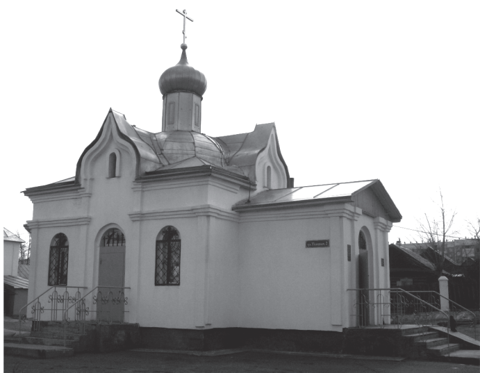
Древлеправославная церковь во имя св.вмч. Варвары г. Улан-Удэ

уважением. Численность древлеправославного прихода Улан-Удэ увеличилась во много раз, так что теперь христиане безбоязненно строят уже большую кафедральную церковь во имя Рождества Христова, с уверенностью в том, что она не останется недостроенной или будет впоследствии пустовать.