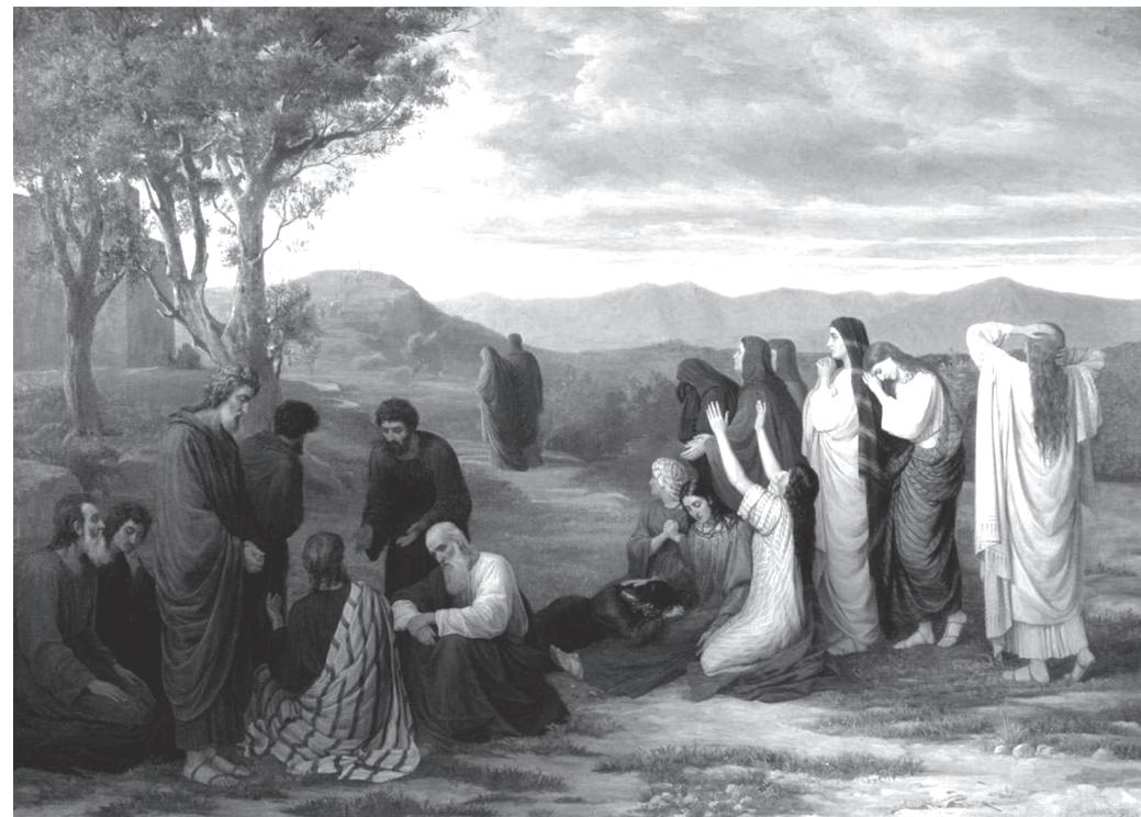
Жены, издали смотрящие на Голгофу. Художник М.П. Боткин. 1867 г.

О душевных добродетелях утверждаем, что главным образом четыре родовые добродетели, а именно: мужество, благоразумие, целомудрие и справедливость. От них же рождаются следующие душевные добродетели: вера, надежда, любовь,