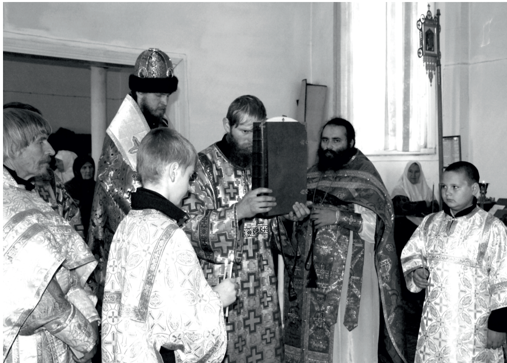
Рукоположение чтеца в храме п. Урск Кемеровской области.