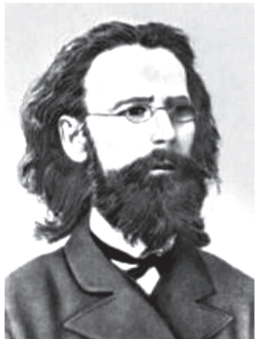
А.П. Щапов — историк, известный исследователь старообрядчества XIX в.

Родился в селении Анге Верхотурского уезда, в 210 верстах от Иркутска, в многодетной семье пономаря Ильинской церкви и бурятки. Его отец вел свой род от священника Щапова, сосланного в Сибирь за приверженность к старой православной вере. В 1852 г. Щапов окончил курс семинарии в г. Иркутске и в числе лучших учеников был отправлен на казенный кошт в Казанскую духовную академию. Здесь Щапов очень усердно работал и тогда уже выделялся из среды товарищей. Большое значение для его последующей ученой деятельности имело знакомство с богатой библиотекой рукописей Соловецкого монастыря, которая во время Крымской войны была перевезена в Казань. Щапов участвовал в составлении описи этих рукописей и сделал для себя множество выписок оттуда. На последнем курсе он весь отдался своей студенческой магистерской диссертации, вышедшей в 1858 г. в Казани под заглавием «Русский раскол старообрядства». Всецело отрешиться от общепринятой до тех пор точки зрения