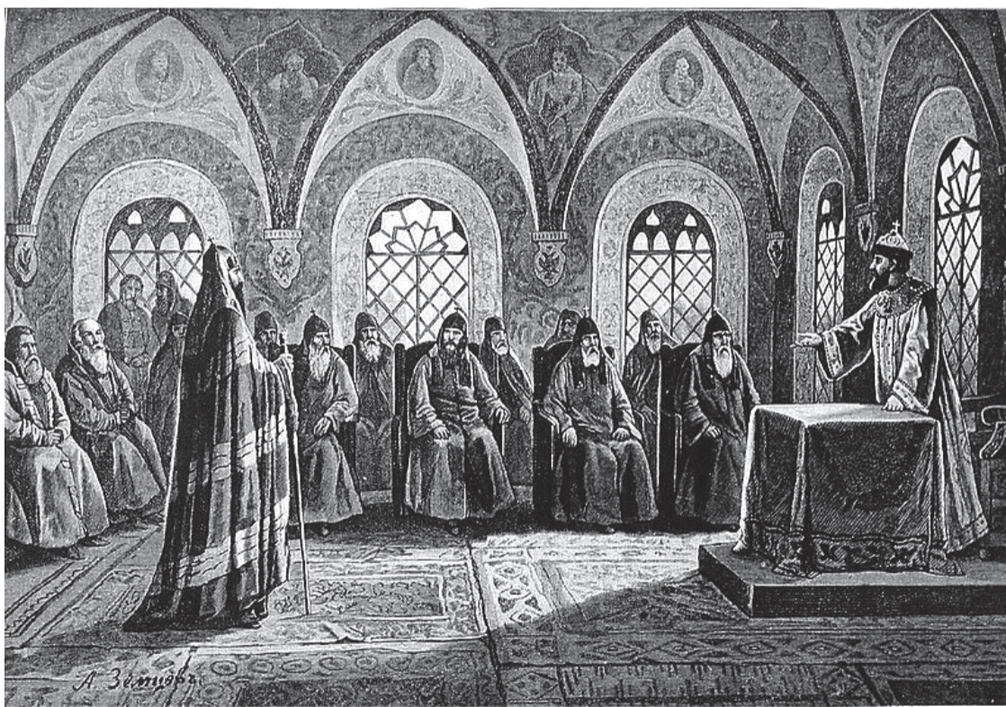
А.Земцов. "Суд на патриархом Никоном". Гравер Шюблер.

И вот эти бесчестные, безверные, безнравственные проходимцы-воротилы громили Древлеправославную Русскую Церковь, проклинали ее вековое благочестие, еретичили ее церковные обычаи, порядки, чины, богослужебные книги и