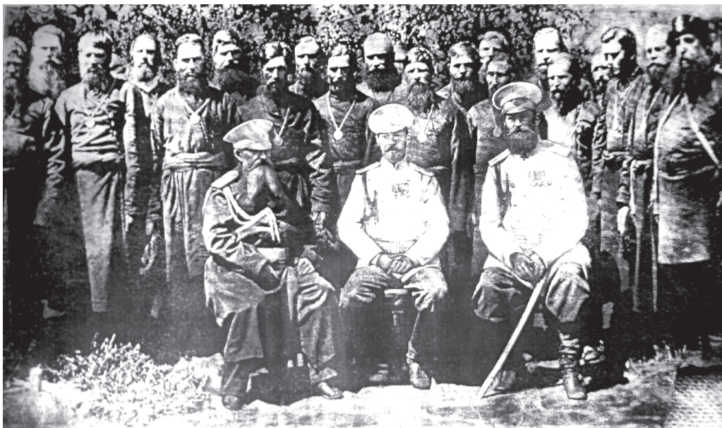
В 1891 году проездом из Японии цесаревич Николай II в г. Верхнеудинске (Улан-Удэ) в сопровождении Иркутского губернатора и телохранителя наградил старообрядческих уставщиков всех семейских сёл Бурятии за выращивание хороших урожаев хлеба.

Между различными духовными центрами стал налаживаться диалог, в старообрядчестве начался процесс единения. В истории России это был золотой век старообрядчества. Жаль, что он был кратковременным и