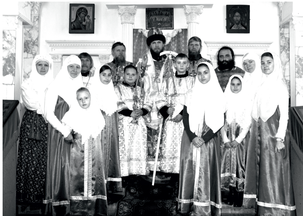
Священнослужители и клирошане в храме п. Урск Кемеровской области.

встречи. Помолившись три поклона на Божий храм, владыка воспел приветственный стих из 112 псалма: «Хвалите, отроцы, Господа, хвалите имя Господне!». В ответ