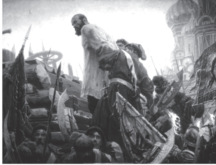
Художник С. Кириллов. Казнь Степана Разина.

Св. Вавила родился в Западной Европе, окончил парижскую академию, был умудрен в богословии и светских науках, владел греческим, латинским, еврейским,