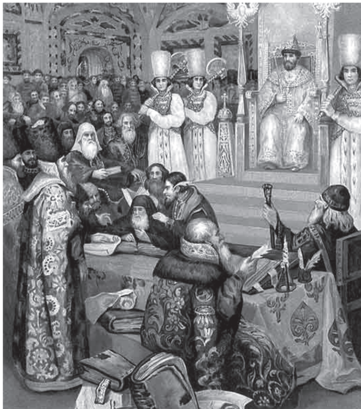
Художник Некрасов Н.Ф. Составление Соборного уложения при царе Алексее Михайловиче

вынесли определения по всем церковным вопросам, вызвавшим волнение и смуту в Русской Церкви. Все эти определения были повторением того, что было изложено в деяниях собора 1666 г., в книге «Жезл правления» и в сочинении архимандрита Дионисия. Собор признал никоновские книги, которые сам Никон заподозрил, «право исправленными»; триперстное сложение закрепил как неизменный догмат веры: будем «держатъ его вечно и неподвиж-