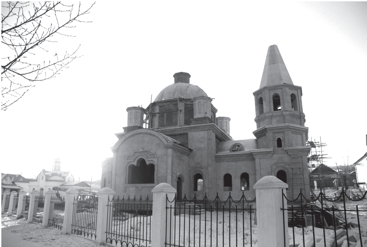
Строящийся древлеправославный храм во имя Рождества Христова в г. Улан-Удэ. Декабрь 2011 г.

Слава Богу продолжается и строительство нового храма во имя Рождества Христова. В 2011 году был забетонирован главный купол, начались кровельные и отделочные работы. Конечно, очень хотелось закончить крышу церкви полностью, но к сожалению, работа оказалась очень сложной и кропотливой. Будем надеяться, что в наступающем году церковь украсят купола, луковичы и кресты, тем более, что уже куплена и