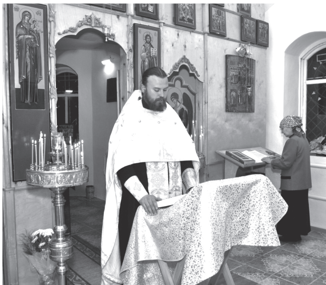
Служба в церкви с. Новый Заган.

То же говорится в первом слове «Тактикона» Никона Черногорца (вторая половина XI в.). В Следованном Псалтыре митр. Киприана (1379-1406) сугубление аллилуйи определяется как единственный способ возгласения песни. У Симеона Солунского также имеется подобное указание. Стоглавый Собор 1551 г. постановил: «Не подобает аллилуйя трегубити, но дважды да глаголют аллилуйя, а в третье