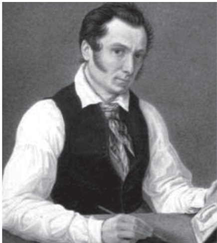
Декабрист Н.А. Бестужев. Автопортрет. 1837-1839 гг.

Как все старообрядцы, они не употребляют ни табаку, ни чаю, ни вина, ни лекарств, все это почитают за грех, они не прививают оспы, но видно вера их крепка - ни одного не встретили меж ними рябого. Они