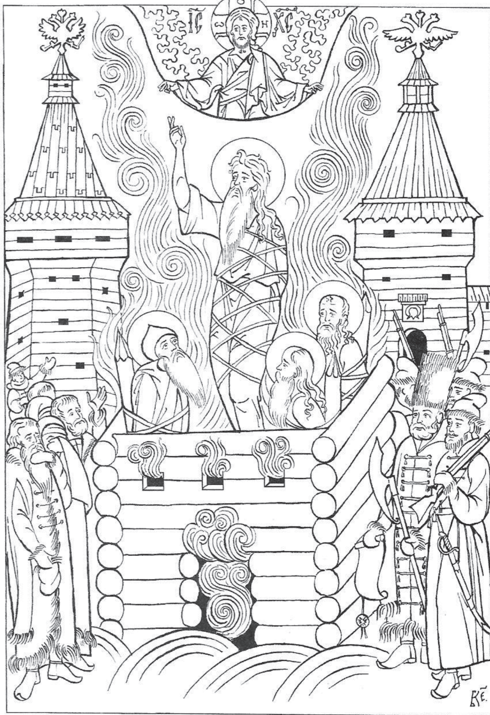
Казнь протопопы Аввакума, попа Лазаря, диакона Феодора, инока Епифания

Весною 1666 года Аввакума под стражей повезли в Москву для суда на большом церковном Соборе. Сначала его держали в Пафнутиево-Боровском монастыре, безуспешно уговаривая принять новые обряды. Затем отвезли в Москву, где после прений о вере повели в Успенский собор, расстригли и предали анафеме. 30 апреля 1667 года несломленного Аввакума поставили