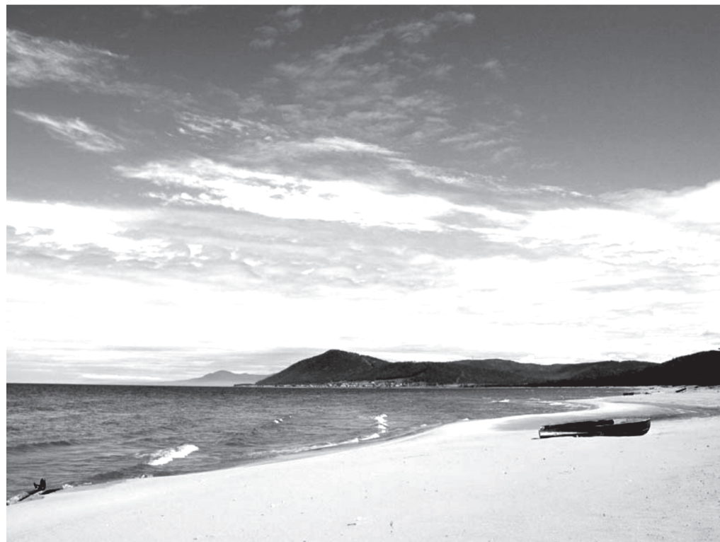
Озеро Котокель, Прибайкальский район

В начале периода коллективизации в селе создан колхоз им. Ленина. Количество пашен и сенокосов крайне ограни-