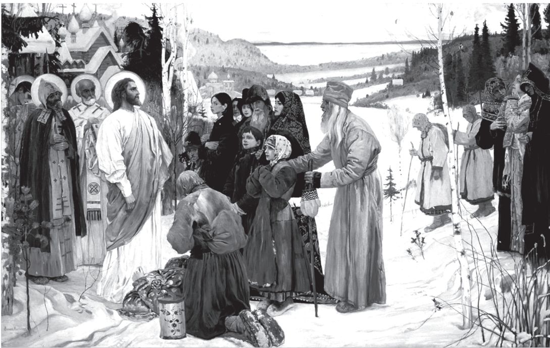
Святая Русь. Художник М.В. Нестеров

гонитель христиан, св. священномученик Киприан — бывший царедой и служитель бесов, преп. Моисей Мурин — некогда разбойник, преп. Мария Египтянина — раскаявшаяся блудница и множество других. Но благодатную силу ко спасению всем им дала Церковь — через св. Крещение, согревшим же по Крещении — через таинство Покаяния и достойное соединение с Христом в таинстве св. Причащения Тела и Крови Христовых.