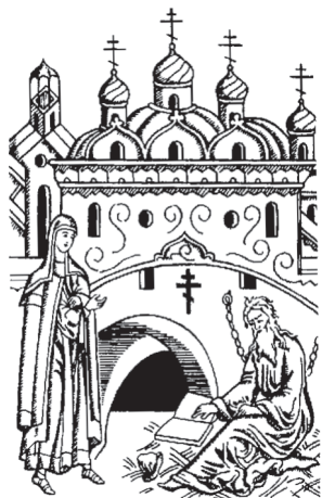
Издание Сибирской Епархии Русской Древлеправославной Церкви

Есть в Бичурском районе, в 20 километрах от Бичуры, красивое семейское село Новосретенка. Находится оно в прекрасном месте Бурятии, где встречаются бескрайние степи и горные хребты, покрытые тайгой. Это село можно сразу узнать из тысячи других. Небольшое, в несколько километров, три длинные улицы с домами, соединенные один с другим заборами, которые пересекаются переулками. Крепкие рубленые из круглого леса дома, украшенные резными наличниками и карнизами. Высокие ворота, колодцы с журавцами. Основали в 1922 году переселенцы из районного центра, сменившие место жительства из-за нехватки земли. Так случилось, что основной переезд пришелся на 15 февраля, праздник Сретения Господня. Поэтому и новое поселение назвали Новосретенкой.