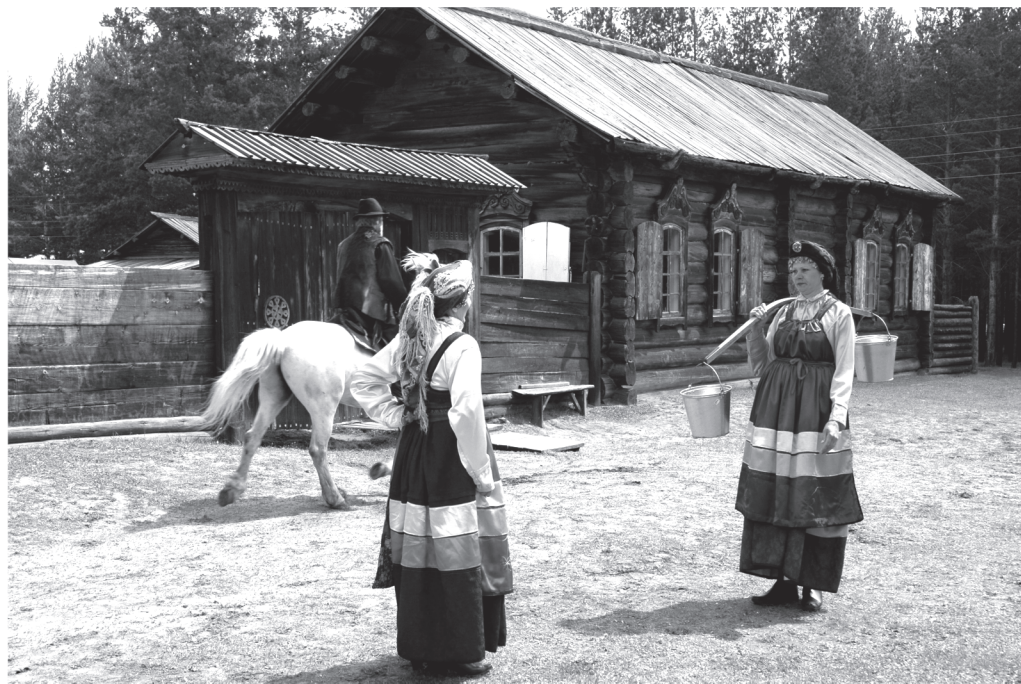
Семейский комплекс. Встреча старообрядцев мира «Путь Аввакума». 2007 г.