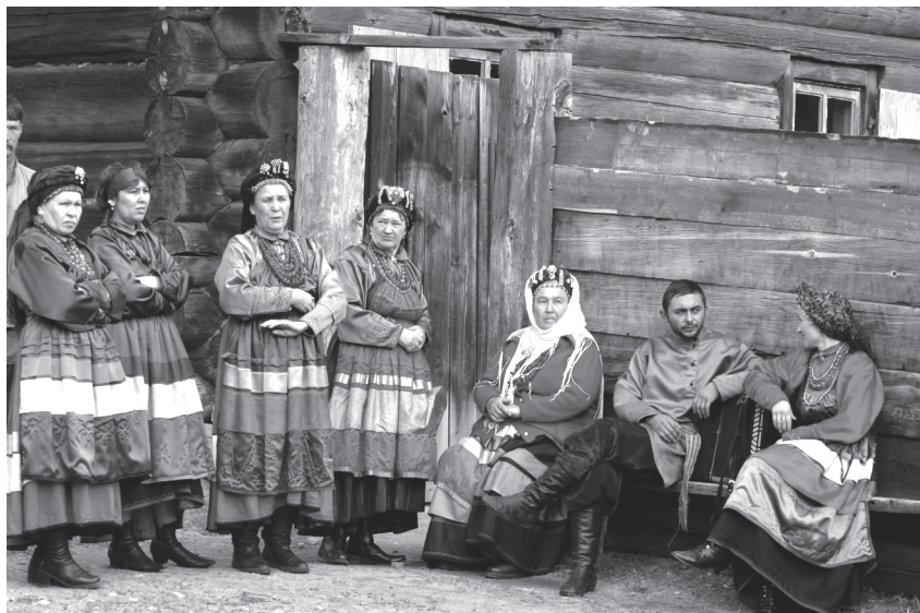
Семейский комплекс. Встреча старообрядцев мира «Путь Аввакума». 2007 г.