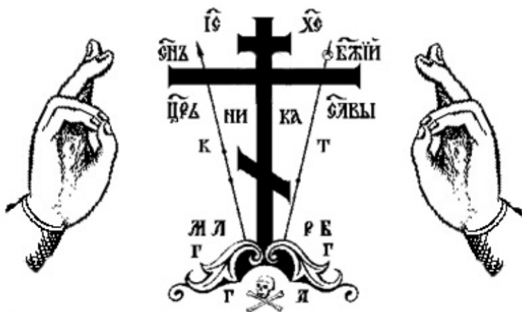
Перстосложение священника и христианина в Древлеправославной церкви.

участники собора знали о том, что двоеперстие издревле содержится Церковью и утверждено собором 1551 года, однако страх перед скорым на расправу и безжалостным патриархом Никоном взял верх над совестью и, боясь разделить участь несчастного страдальца епископа Павла Коломенского, все архиереи Русской Церкви и видные ее священники отреклись и прокляли то, в чем родились и что сами содержали до этого злосчастного собора.