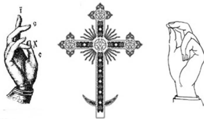
Перстосложение священника и прихожанина в новообрядческой церкви.

Собор произвел персональный суд над некоторыми защитниками Древлеправославия, а за тем со ссылкой на то, что церковная реформа и книжная справа патриарха Никона соответствуют воле восточных Церквей и, якобы, их древней практике, а также осуществлены с совета и благословения восточных иерархов,