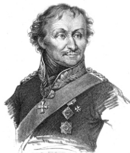
Старовер атаман М.И. Платов - герой Отечественной войны 1812 года

Пресыщение — начало всякого вреда. Ибо вместе с роскошью, пьянством и всякого рода лакомствами, тотчас возникают все виды скотской невозможности. От этого люди, как скоро роскошь вонзится свое жало в душу, делают кони женоистовни (Иер. 5, 8). У упившихся и естество превращается: в естестве мужеском вожделяют они женского, и в женском мужеского.