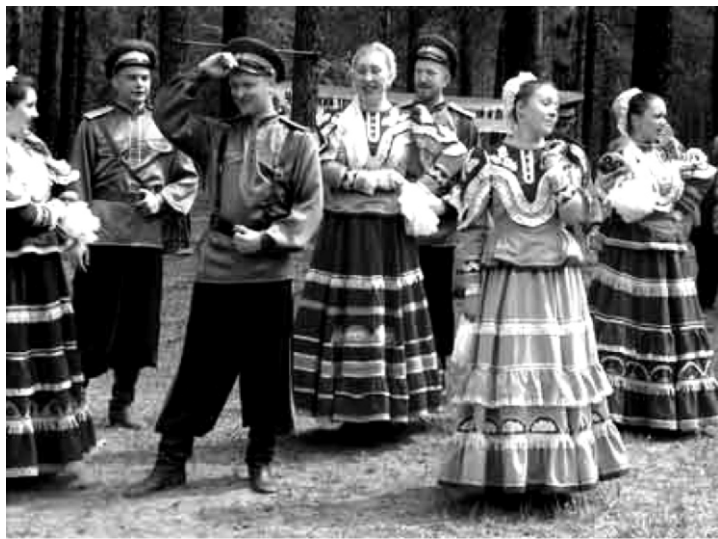
Творческий коллектив «Забайкальские казаки».

Таковы некоторые данные о казаках — последователях старообрядчества в Забайкалье.