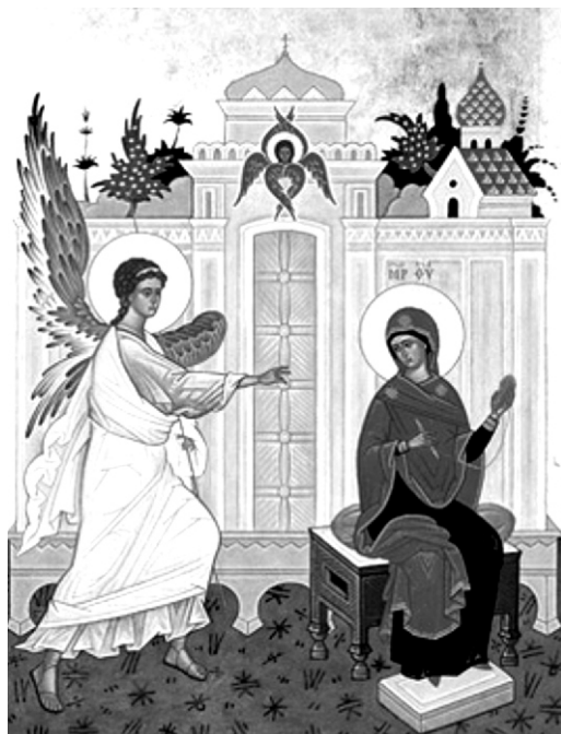
Благовещение Деве Марии Мф. 1:18-25; Лк. 1:26-38

Однажды Марии явился ангел Гавриил, посланный Богом. Он сказал ей: «Радуйся! Бог избрал тебя среди всех женщин».