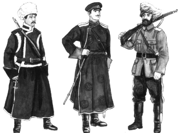
Форма Забайкальских казаков.

Забайкальское казачество — довольно сложный феномен российской действительности. За Байкалом была усложнена его сословно-этническая структура. В состав «служилых людей» были определены аборигены края (буряты и эвенки), позднее — крестьяне и горнозаводские рабочие. Если этносословная принадлежность казаков Забайкалья более известна, то об их этноконфессиональной принадлежности написано очень мало. Между тем казак — это особый духовно-психологический тип.