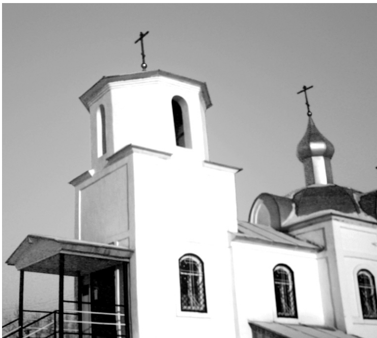
Храм Покрова Пресвятой Богородицы, с. Новый Заган.

В 2004 году в селе Новый Заган Мухоршибирского района был открыт вновь построенный храм Русской Древлеправославной Церкви в честь Покрова Пресвятой Богородицы. За этот период в стенах храма произошло уже много Богоугодных событий: крещение детей и взрослых, венчание, постоянное проведение праздничных и воскресных служб, поминовение усопших — все это сопровождалось звоном одного колокола.