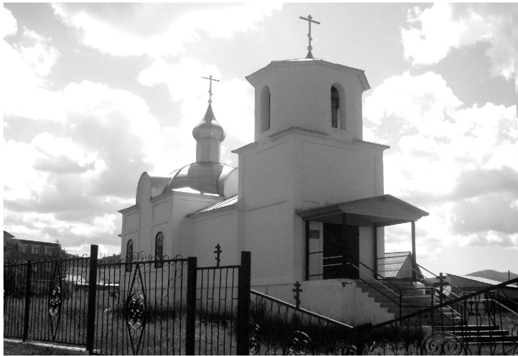
Новозаганская древлеправославная церковь во имя Покрова Пресвятой Богородицы.

В марте 1767 г. северо-западнее «Заганской деревни», появилось новое поселение, которое основали старообрядцы (семейские). Эта группа староверов была выведена из Польши в 1764 г. из местности, именуемой Веткой.