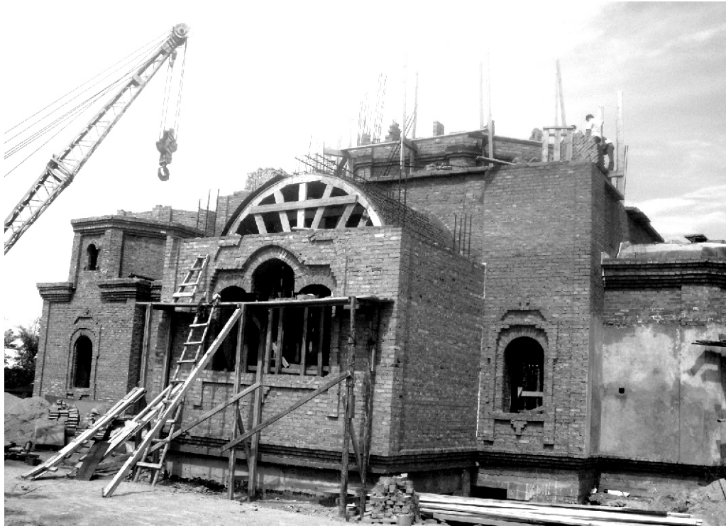
Строящийся храм Рождества Христова. г. Улан-Удэ. Июль 2010 г.