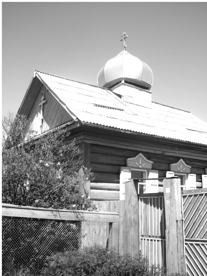
Церковь святых всехвалных верховных апостолов Петра и Павла. с. Шаралдай Мухоршибирского района